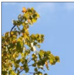
ARKIV OG BIBLIOTEK