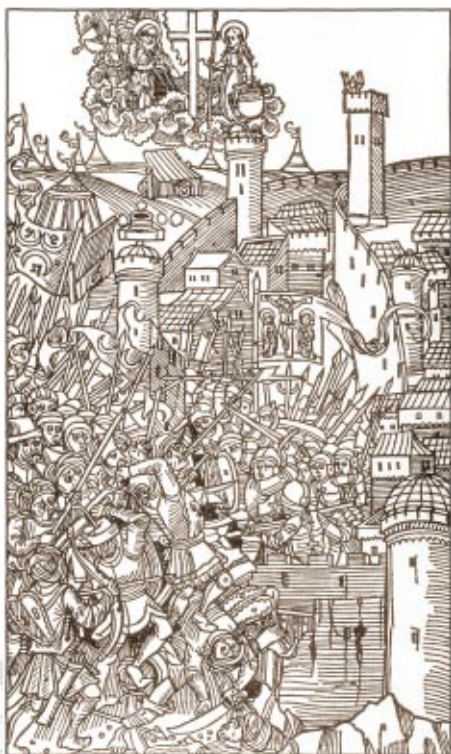
Danmarks første trykte bog, Breviarium Ottoniense , blev muligvis trykt i Skt. Knuds Kloster i 1482. Hidtil havde man klarret sig med håndskrevne bøger, som blev skrevet af igen og igen. Men der indsneg sig mange fejl. Og derfor blev den tyske bogtrykker Johan Snell kaldt til Odense, hvor han blandt andet trykte Descriptio obsidionis urbis Rhodie , der er en beskrivelse af tyrkernes belejring af Rhodos i 1480. Tryk fra bogen, der viser tyrkernes angreb på byen Rhodos.