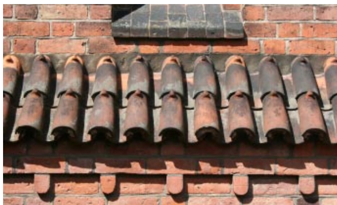
De udenlandske munke bragte megen ny viden med sig. Det gælder f.eks. bygningskunsten. Det er ikke tilfældigt, at de middelalderlige teglsten kaldes munkesten, og at det mest almindelige tegltag var lagt med "munke og nonner".