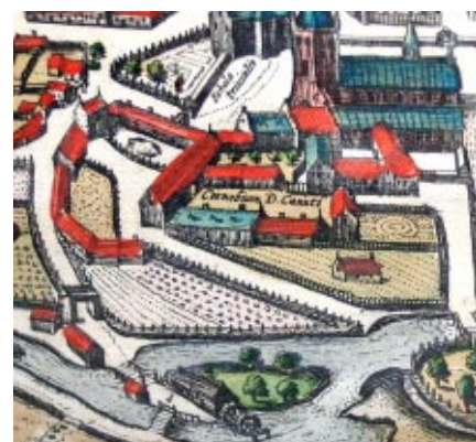
Munkene vidste også besked om mølledrift, og Munke Mølle blev anlagt af munkene i 1100-årene. Møllen, der lå ved åen neden for klostret, fik stor økonomisk og produktionsmæssig betydning - i flere år skulle byens borgere lade deres korn male på Munke Mølle. Munkene havde også fiskeretten mellem Munke Mølle og Ejby Mølle, som lå længere østpå ved landsbyen Ejby.

Munkevæsenet tog sin begyndelse i det 4. århundrede. Den tids munke trak sig tilbage for at leve i ensomhed i bjergene eller i ørkenen og helligede sig åndelige øvelser i kampen mod djævelens fristelser og synd. Dette blev munkevæsenets formål til alle tider. Kun ved indre samling og bøn kunne munkene afstå fra al deres ejendom, personlig frihed og familieliv - og udføre en særlig opgave i fællesskabet.