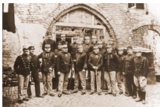
Skt. Knuds Klosters var også hjemsted for en militær husflidsskole, som her er fotograferet i 1913 foran havefløjen.