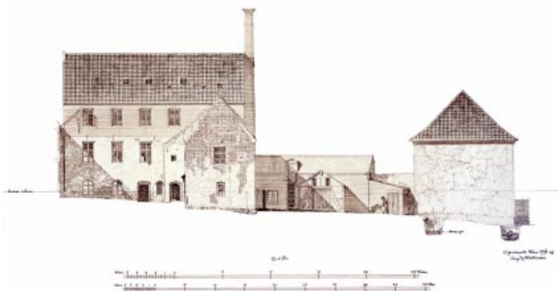
Nationalmuseet lavede i 1894 en opmåling af klosteret. Her ses de stærkt ombyggede klosterbygninger fra syd. Den østlige halvdel af sydfløjen var tidligere revet ned - undtagen en mur ud mod klostergården (tegning af Aage Langeland Mathiesen).

Allerede fra 1890'erne kom det på tale, at kommunen skulle købe de forfaldne bygninger og føre dem tilbage til deres oprindelige skikkelse. Sagen blev dog nedstemt i byrådet – i første omgang!