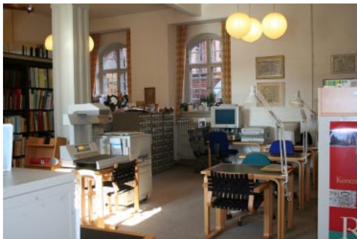
Fra 1978 til 2006 havde Lokalhistorisk Bibliotek et par mindre lokaler i underetagen af Skt. Knuds Kloster. I dag er der arkivmagasin.

Siden august 2007 har man officielt benyttet navnet Historiens Hus som betegnelse for samarbejdet mellem bibliotek og arkiv. Skt. Knuds Kloster er i dag et historiens hus for byens borgere. Her kan man fordybe sig i lokalhistorisk materiale og litteratur, eller man kan deltage i de mange foredrag og andre arrangementer, som året rundt finder sted i huset.