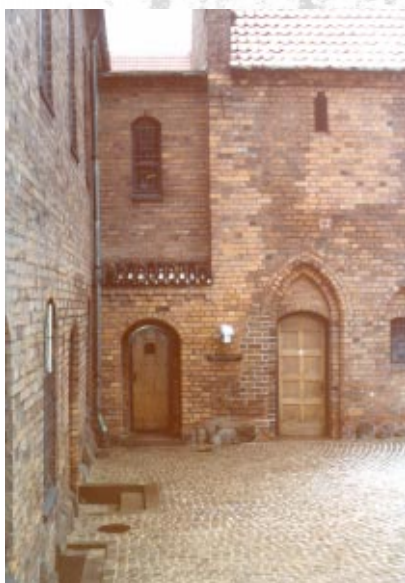
Biblioteksfilialens og senere Lokalhistorisk Biblioteks indgang set fra Klosterbakken i 1970'erne.

I Historiens Hus bliver der ofte afholdt foredrag og arrangementer af kulturel karakter. F.eks. kunne man i maj 2008 høre et foredrag om kartofflens kulturhistorie samt overvære opførelsen af en "kartoffelopera". Der er også mange foredrag af lokalhistorisk karakter.