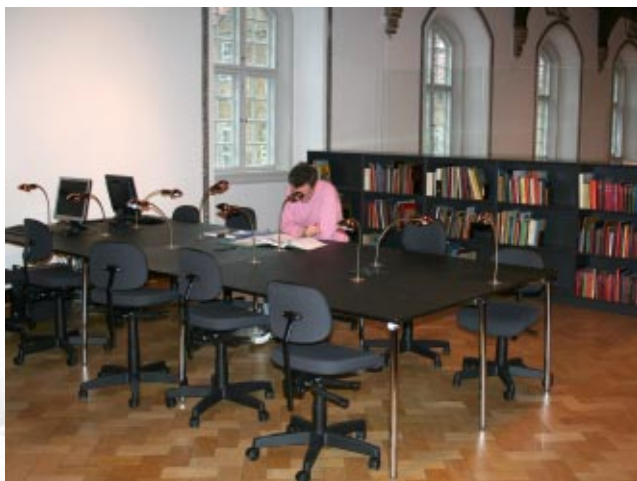
I november 2006 blev den fælles læsesal for Lokalhistorisk Bibliotek og Odense Stadsarkiv indviet. Som et af de få steder i landet bliver borgerne betjent af både biblioteks- og arkivpersonale.